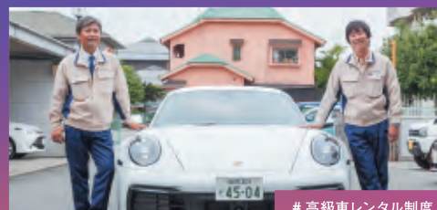
#高級車レンタル制度