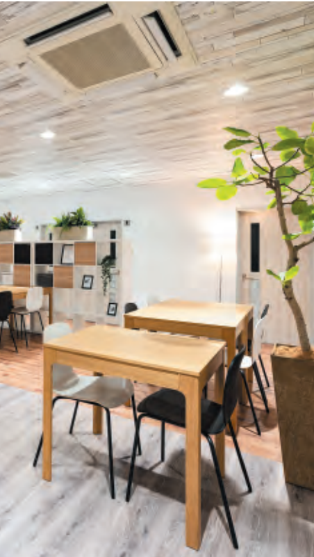
姫路本社 3F Oasis