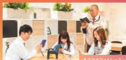
#スマホフォトレッスン